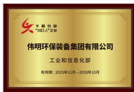
专精特新“小巨人”企业