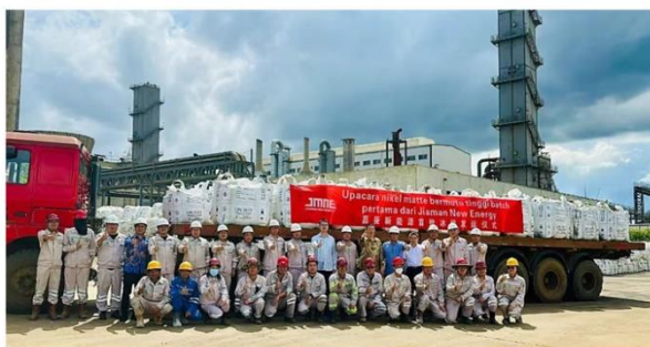
嘉曼项目首批产品发运

新能源集团持续推进产业布局，拟出资人民币 8,000 万元，参与福建泉州年产 6 万吨碳酸锂项目 10% 权益的投资。报告期内，嘉伟新能源集团累计获得产业政策奖励及研发补助约 1,477 万元。