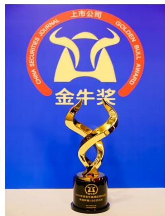
2024年度最具投资价值金牛奖