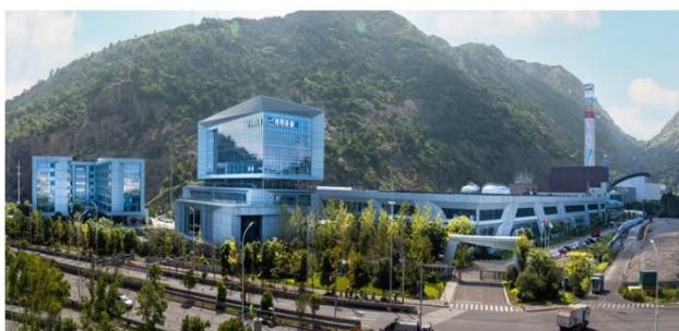
伟明装备集团装备制造产业基地

2025 年度，公司及下属装备制造公司新增设备订单总额约 46.35 亿元，并成功拓展深圳盛屯集团有限公司等重要战略客户。由于订单执行进度等原因，报告期内公司设备、EPC 及服务收入有所下降，2026 年努力加快订单执行和交付。伟明装备集团持续推动技术创新与产品研发，成功开发氧压釜搅拌器、双锅跳汰机、研磨机、隔膜泵单向阀、吊车机器人、智能燃烧控制系统及黑匣子系统新产品，积极拓展光伏业务，实现盛青二期、装备厂区、东阳、文成等多个屋顶光伏项目并网发电。产能布局方面，伟明装备集团度山基地一期已完成达产验收，二期新增取得 52 亩扩建用地，计划进一步提升装备制造能力。凭借在技术创新与专业能力方面的突出表现，伟明装备集团于本年度获评为工业和信息化部专精特新“小巨人”企业及省级企业技术中心，行业地位与核心竞争力持续增强。报告期内，伟明装备集团累计获得产业政策奖励及研发补助约 2,706 万元。