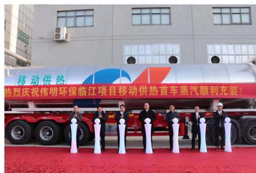
临江项目二期对外供蒸汽