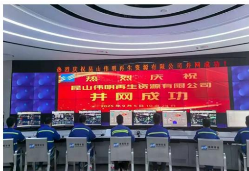
昆山再生资源项目并网成功