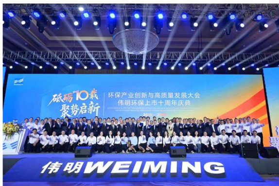
环保产业创新与高质量发展大会