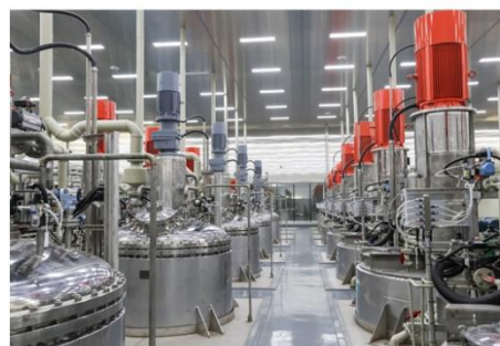
伟明盛青前驱体车间